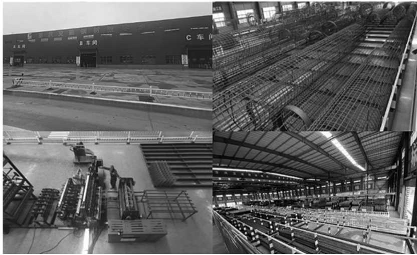
图 1 奉建高速钢材数字加工厂现场图

如图 2 所示, 本方案包含钢筋集中加工配送业务的全流程: A.订单管理; B.深化设计(含基于 BIM 模型的翻样软件及路桥专版翻样工具等)C.仓储管理(原材管理及余料管理)D.生产管理; E.配送管理; F.质量管理; G.BI 分析等模块。