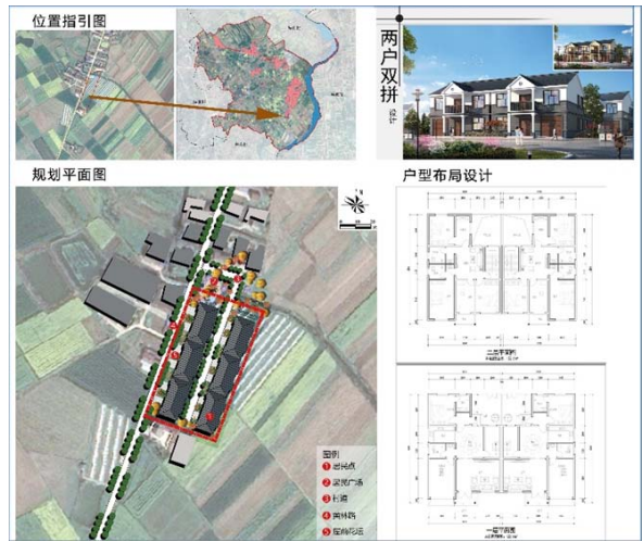
图3 居民点建设规划图

续的大鼓文化，规划经济和社会文化项目的综合规划，在每年的重要节日进行表演，以此促进中国农村全面振兴（见图3）。