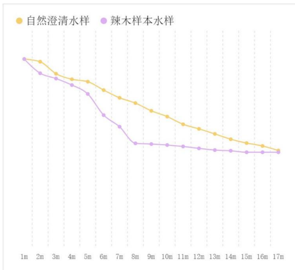
图3 辣木籽随时间变化对水质影响图