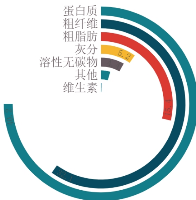
图2 辣木籽油粕成分分析