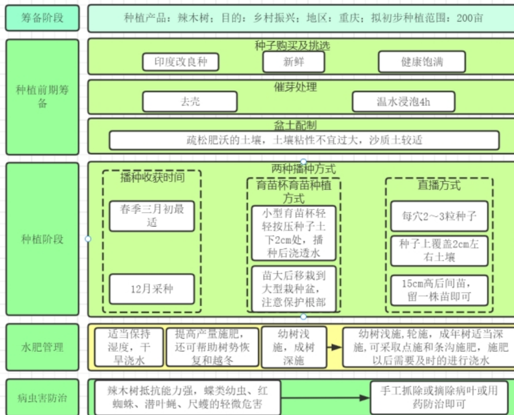
图 1 辣木树栽种过程

辣木树对于生长环境的适应性较强, 比较容易生长。但想要长得更好, 要用疏松肥沃的土壤。土壤粘性不宜过大, 否则会导致根须呼吸不畅, 一般用沙质土栽种为宜。一般在栽种时间为每年三月份, 种植分为育苗、移栽、施肥、病虫害防治、树木管理、收果六个过程, 具体流程图如下图 1: 由图 2 图同时我们发现辣木籽在水中又能起到絮凝杂质的作用, 可以加快鱼塘水的净化和互换的效率, 对于维持水质质量有着积极地促进作用。