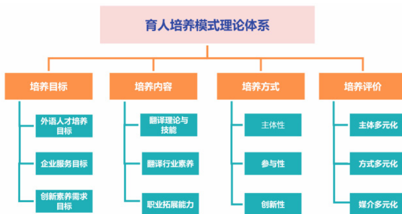
图2 “三维融合双循环”育人模式理论体系图