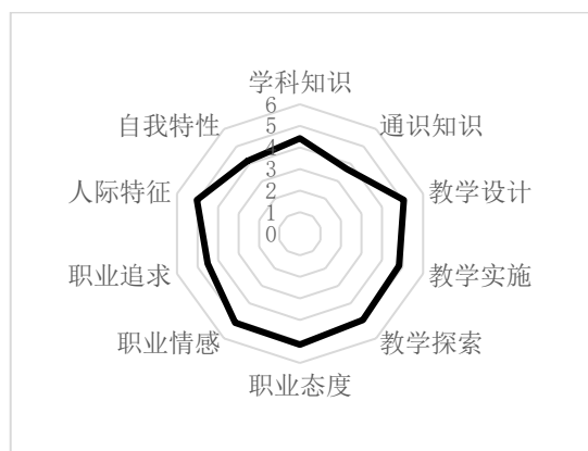
图1 小学英语教师跨学科能力调研结果

个人特质维度: 人际特征得分 5.03 较高,表明教师在人际交往和团队合作方面表现良好,但自我特性得分 4.16 较低,反映出教师对自身独特优势和特点的认识不足,可能影响其在跨学科教学中个性化教学方法的运用和创新。