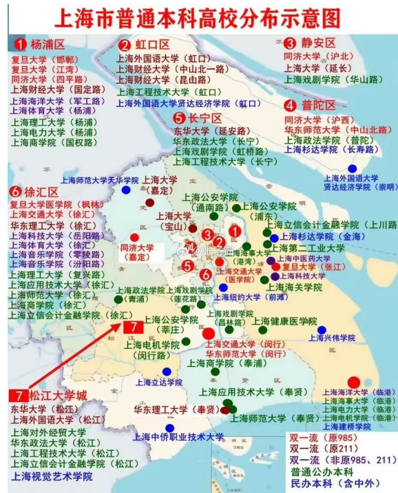
图4 上海市普通本科高校分布示意图 (上海发布微信公众号)