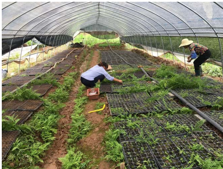
图 2 植物修复技术实施和样本收集

高的准确性。如图 2 所示, 治理区域管理人员正在进行植物修复技术实施和样本收集。植物修复技术研究是一个严谨的过程中, 其数据支持非常重要, 尤其是数据的准确性, 一旦数据准确性出现问题将会严重影响植物修复技术的研究进程。